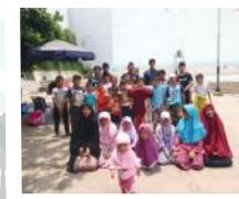
AKTIVITAS AHAD PAGI