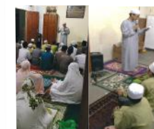
PENGARAHAN PROGRAM TAHFIDZ CILIK OLEH PENGASUH