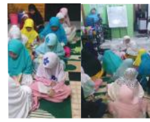
SETORAN TAHFIDZ PUTRI