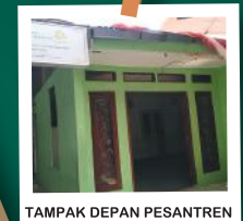
TAMPAK DEPAN PESANTREN