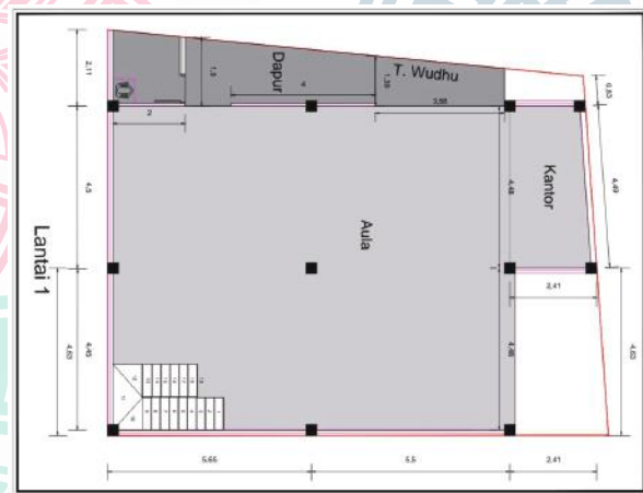
DENAH AULA DAN ASRAMA SANTRI