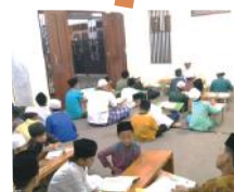
SETORAN TAHFIDZ PUTRA