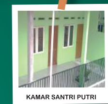
KAMAR SANTRI PUTRI